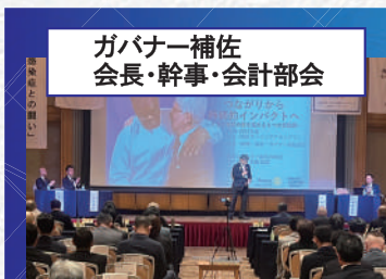
ガバナー補佐 会長・幹事・会計部会