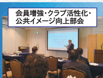
会員増強・クラブ活性化・ 公共イメージ向上部会