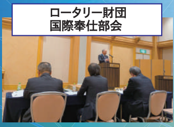
ロータリー財団 国際奉仕部会