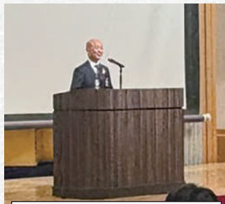
ガバナーノミネー 早坂 竜太